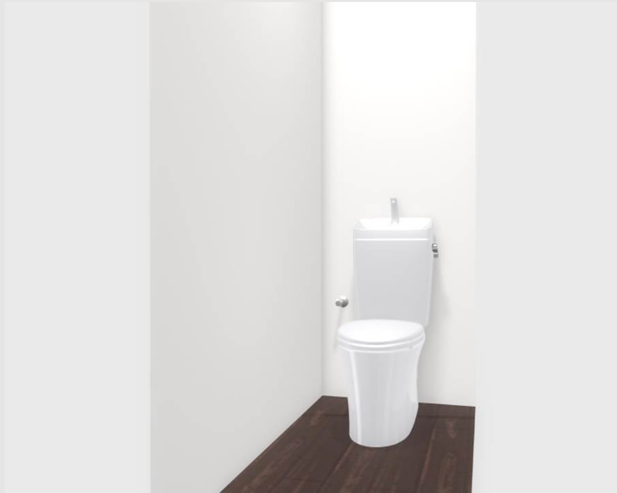
3DCGによるイメージ画像です。 反対壁に設置されている商品がある場合は表示されておりません。