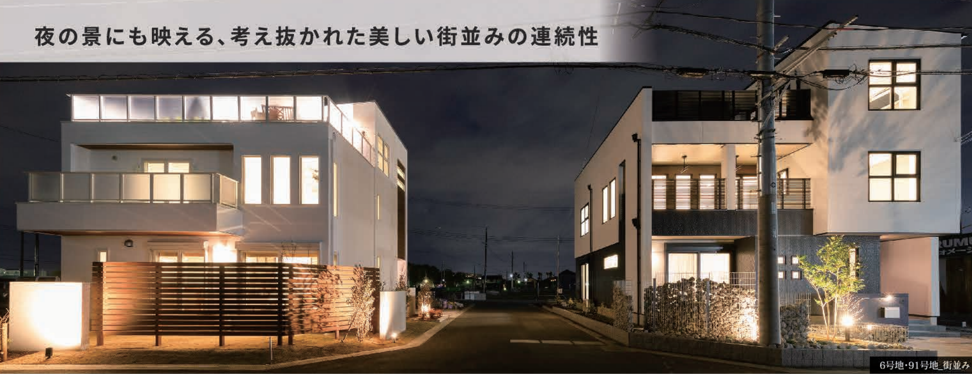
6号地・91号地 街並み

91号地 NEW MODEL HOUSE 4LDK+SIC+吹抜け +納戸+ファミリークローゼット+ワークスペース